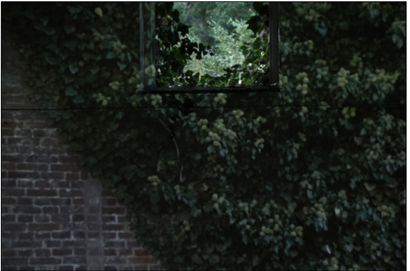
inside-out, diest, 2016

L'installation n'a pas de forme fixe mais cherche plutôt à créer une situation en relation avec le lieu de présentation et l'environnement local. L'origine du flux restera à la fois suffisamment proche pour garder un lien géographique cohérent, et suffisamment éloigné pour créer un écart dans la vision. In situ, par cette ouverture, re-faire le chemin inverse, re-traverser l'espace entre l'oeil et le paysage. Prendre conscience de ce qui nous entoure, de ce qui sépare le lointain et le proche, de leur mouvements et de leur temporalités propres..